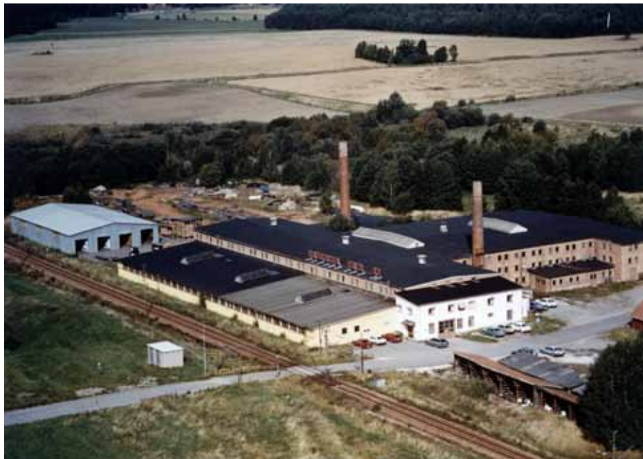
Fabriken i Josefsdal så som den såg ut på 1970-talet.

Men ekonomin var som sagt god; alla fastigheter var betalda och stora lager fanns.