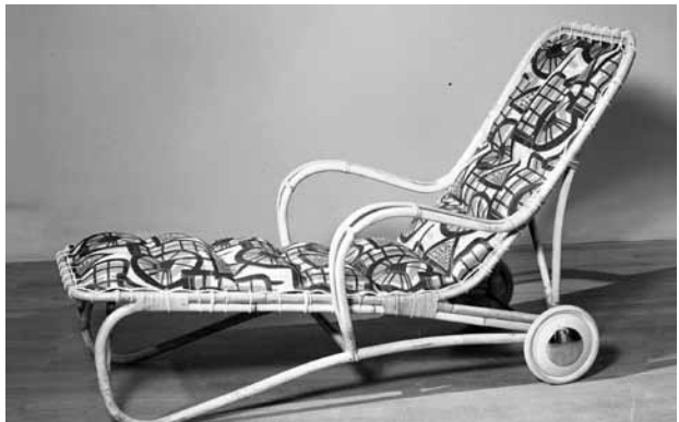
En vilstol som den kunde se ut på 1950-talet.

Med två så skilda verksamheter som sport och fiske och import av