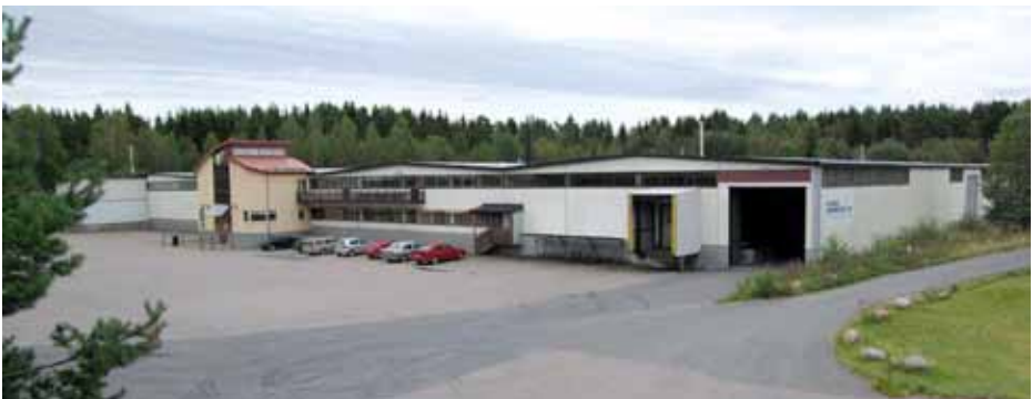
I Sävsjö finns detta lager med omkring 12 000 kvadratmeter under tak.

Under denna expansion har Bröderna Holms finansiella styrka och renommé varit en tillgång. Men dagens Holm Trävaror är ett helt annat företag än på brödernas tid; en leverantör med ett brett sortiment och stora lagerytor på omkring 30 000 kvadratmeter. Det motsvarar mer än 60 fotbollsplaner. Man kan säga att Holm Trävaror fungerar som lagerhållare åt träindustrin.