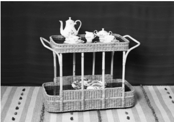
En serveringsbricka från sent 1940-tal.

– Det var ett enormt arbete att lägga in alla artiklar – de var ju flera tusen. En skomodell, till exempel, skulle ha ett nummer för varje storlek och varje färg. Normalt sålde man på våren det som skulle levereras på hösten. Så det gällde att ha reda på hur mycket av en artikel man hade i lager, hur mycket av den som var insålt och hur mycket som behövde köpas in.