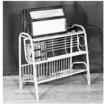
En radiohylla från 1949, tillverkad av Bröderna Holm i Ransta.

Under 1930-talet breddades företagets verksamhet kraftigt: 1934 började man med partihandel med plywood och lamellträ. 1935-36