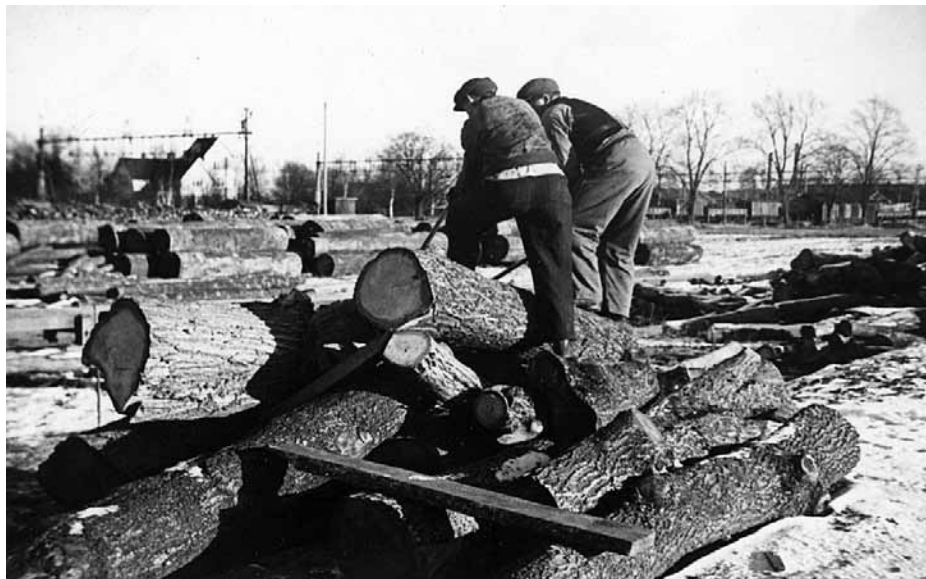
Arbetet i brädgården var länge till stora delar helt manuellt.

– Då kom det 2-3 långtradare i veckan med leverans av spånskivor. Det växte hela tiden, säger Lars Holm.