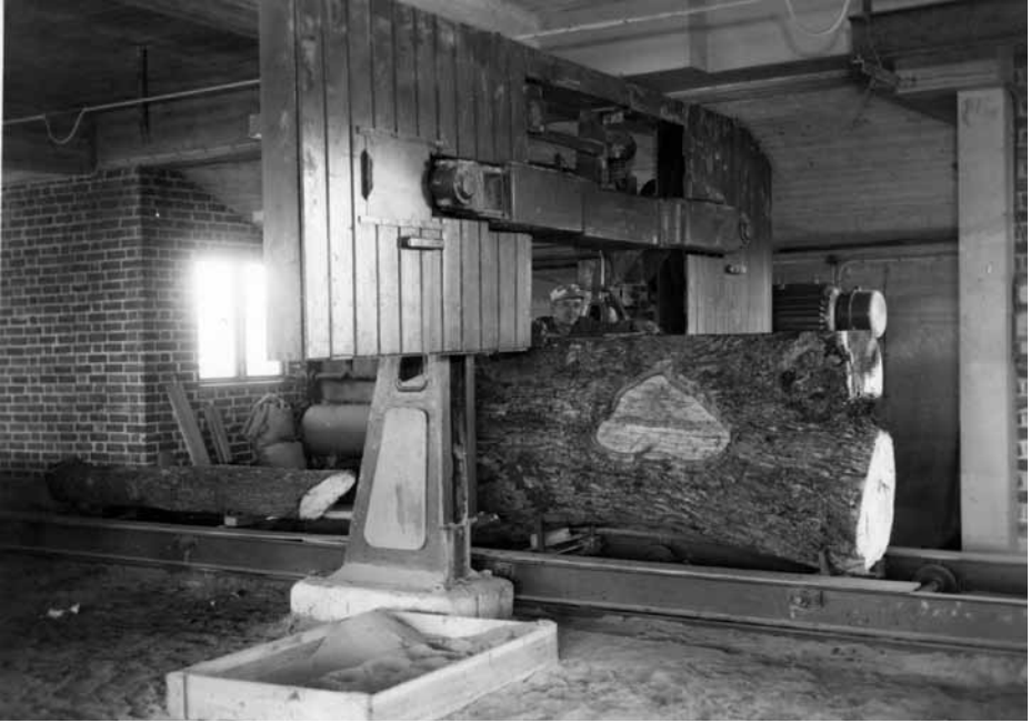
Blockbandsågen i sågverket. Den fanns kvar tills slutet av 1980-talet.