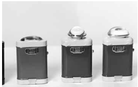
Ficklampor, liksom annan fritidsutrustning, växte under 1960- och 1970-talen till viktiga produkter.