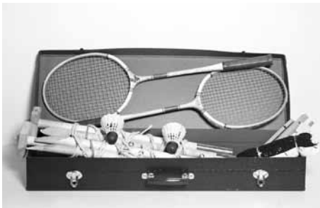
Badmintonutrustning var under en period en artikel där Bröderna Holm hade en framträdande position.

En remburs är ett ovillkorligt åtagande från en bank, oftast köparens bank, att betala säljaren då säljaren presenterar de dokument och uppfyller de villkor som är angivna i rembursen. (från Wikipedia)