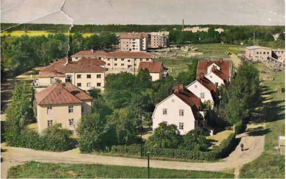
En bild från det gamla Sala där man skymtar Bröderna Holms fabrik i övre högra hörnet. Den större byggnaden finns fortfarande kvar, men resten är rivet.

sångaren och bandyspelaren Gösta ”Snoddas” Nordgren – som var en hängiven sportfiskare – om att få använda hans namn. Såväl ett spö som ett drag och en pirk fick heta ”Snoddas”.