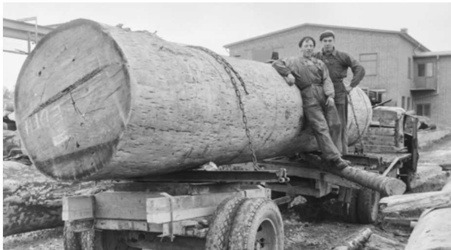
Jättelika mahognystockar sågades upp till båtbyggare och snickerier på sågverket i Sala. Den största stock man hanterat var 12 meter lång och hade en diameter på nästan 2 meter.

ning av rottingmöbler, som var själva ursprunget; partihandeln med fiskeredskap, som utvecklades till att omfatta i stort sett all sport- och fritidsutrustning; och slutligen handeln med trävaror. Det sistnämnda är den verksamhet som fortfarande lever kvar under företagsnamnet Holm Trävaror.